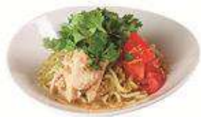
鹽味雞肉香菜乾麵 塩鶏香菜乾麵