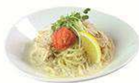
明太子豆乳乾麵 明太子豆乳乾麵