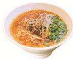
麻辣香菜担担麵 麻辣香菜担々麵